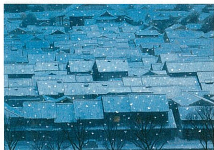
図2 [年暮る] 東山魁夷 1968年

今年度の本同好会は、①ダリ展、生誕100年記念（名古屋市美術館）、②20世紀美術の森（愛知県美術館）、③アメリカ絵画子供の世界（名古屋ポストン美術館）、④川崎小虎と東山魁夷展（岐阜県美術館）、⑤天地をつなぐコンサート、ミネハハ inぎふ・チャリティーコンサート（サンシャインホール）、⑥メナード美術館開館20周年記念展（メナード美術館）、⑦庄野真代・麻倉未稀ジョイントコンサート（サラマンカホール）等絵画、音楽、ポップスと多彩な芸術を鑑賞する機会をもちました。今回はその中から個人的にも好きな日本画家の川崎小虎と東山魁夷のそれぞれ対照的な絵画2点を紹介します。川崎家は尾張徳川家の代々浮世絵師の家系で、小虎は1886年に岐阜県で生まれ祖父の千虎から大和絵の手ほどきを受けた。図1は小虎38歳の作品である。暖かい色調の中に飛鳥美人を彷彿させる二人の天女が竖琴を手に、蝶の乱舞するお