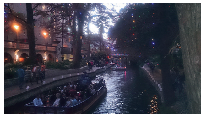
アラモの砦とリバーウォーク。この二つを知ればサンアントニオを制したようなものかもしれません。

明する場面もありました。時には恥をかいたり、大きな間違いをしてしまったりといろいろなトラブルもありましたが、こういうことも若さゆえにできることなのだと思います。あります。