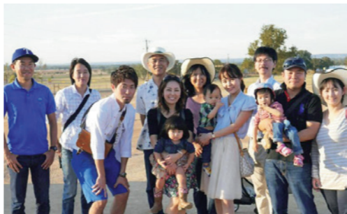
現地で開業されている先生、留学中の先生と一緒に小旅行もしました。