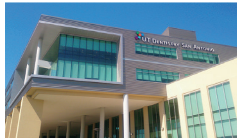
留学中に歯科の新病院が完成。その歴史的な瞬間に立ち会えたことは素晴らしいことだったと思います。