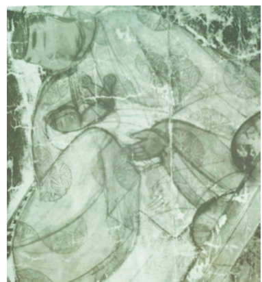
写真3 源氏物語 柏木三 「薫を抱く源氏」部分 (透過赤外線写真)