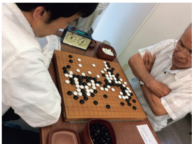
第32回中学地区大学教職員囲碁大会での対局風景

さて、本会では2015年度7月に教職員囲碁大会への参加と学内大会を行いました。中部地方の大学の囲碁同好会が参集した第32回中部地区大学教職員囲碁大会は2015年7月5日(日)に日本棋院中部総本部にて行われました。大会は参加選手を、なるべく棋力の接近した4ないし6名から成るブロックに分け、ブロック毎にハンデ戦による個人戦を3回戦行い、チーム全員の勝率によって大学間で順位を競いました。結