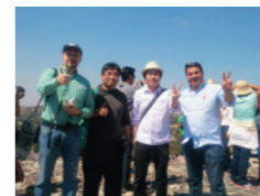
テキサス・サンアントニオ。テキサス州の南部、メキシコとの国境近くに位置します。メキシコには飛行機で2時間で行くことができます。私もメキシコの姉妹校にいる先生に会いにいきました。