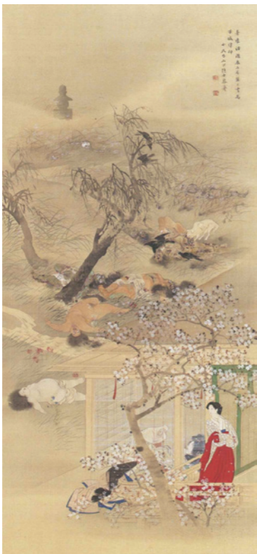
写真2 菊池容斎 九相図 (ポストン美術館)