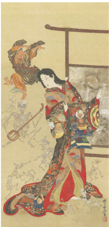
写真1 河鍋暁斎 地獄太夫 (ポストン美術館)