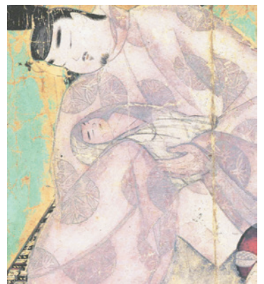
写真4 源氏物語 柏木三 「薫を抱く源氏」部分 (原画)