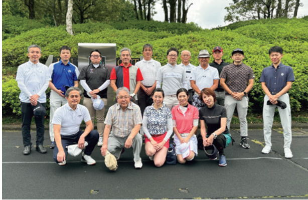
第55回ながら会ゴルフコンペでの集合写真

ながら会ゴルフ同好会では、朝日大学教職員の親睦と健康増進を兼ねて年1回ゴルフコンペを開催しております。第55回は2023年10月1日(日曜日)に「やまがたゴルフ倶楽部美山コース」で開催しました。当日はプレー前まで小雨の天気でしたが、コンペ中にはほぼ雨に降られることなく、新規参加者1名を含む総勢17名(5パーティー)が参加するゴルフコンペとなりました。当日は公務ご都