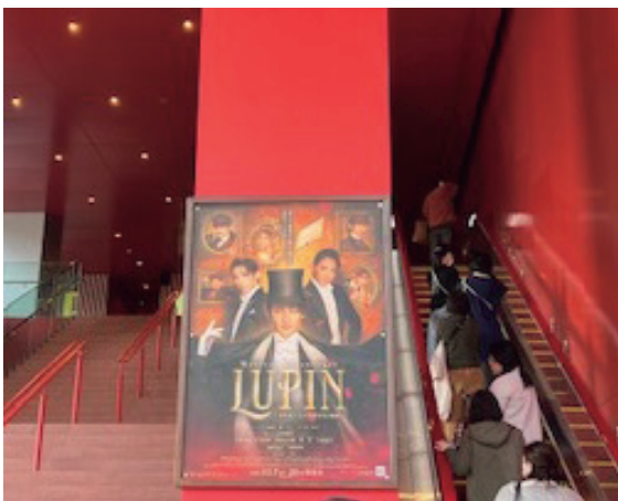
(写真2) いざ会場へ(御園座にて)