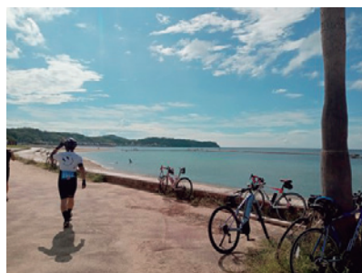
湖畔と自転車 (イベント会場にて)