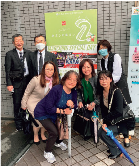
(写真1) ココロかさなるCCNセンター(瑞穂市総合センター)にて