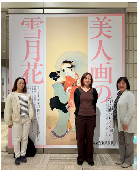
(写真2)「培広庵コレクション 美人画の雪月花」宵の口鑑賞会