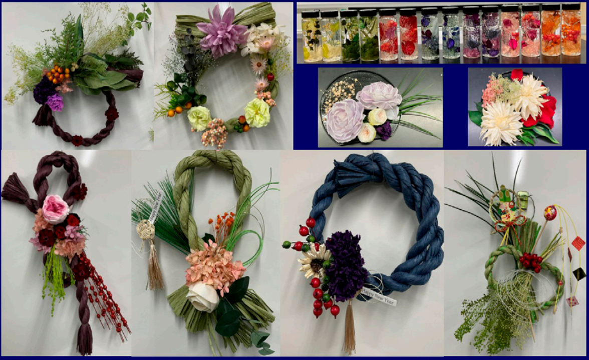
第1回のプレゼントハーバリウムと第2回:お年始の花飾りより