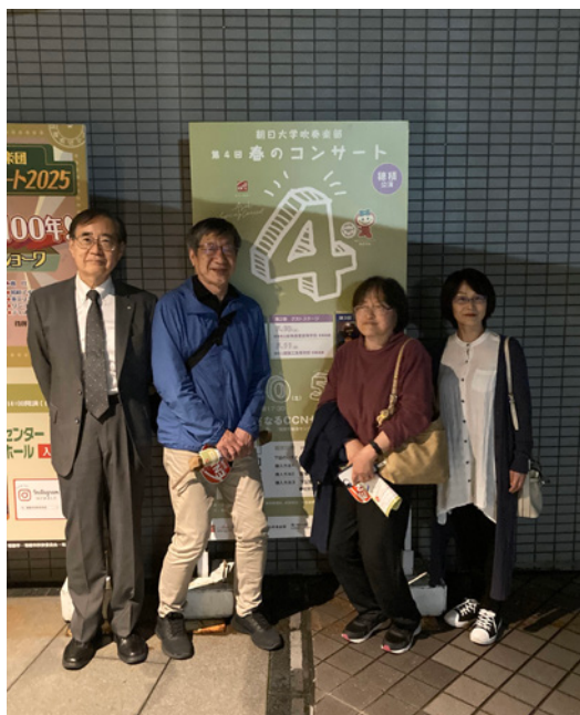
(写真1)朝日大学吹奏楽部 第4回 春のコンサート