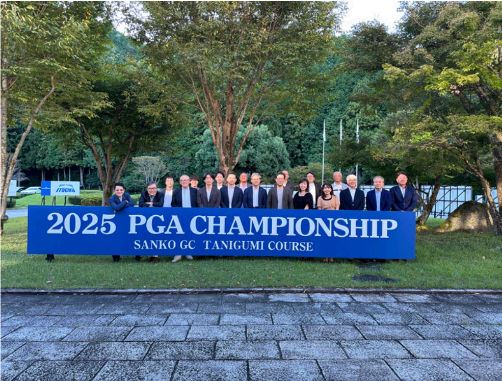
2025年10月13日 三甲ゴルフ倶楽部谷汲コース クラブハウス前での集合写真

22日(日)に「理事長杯」を予定しております。ゴルフが上手な方も、初心者の方も皆様奮ってご参加ください。